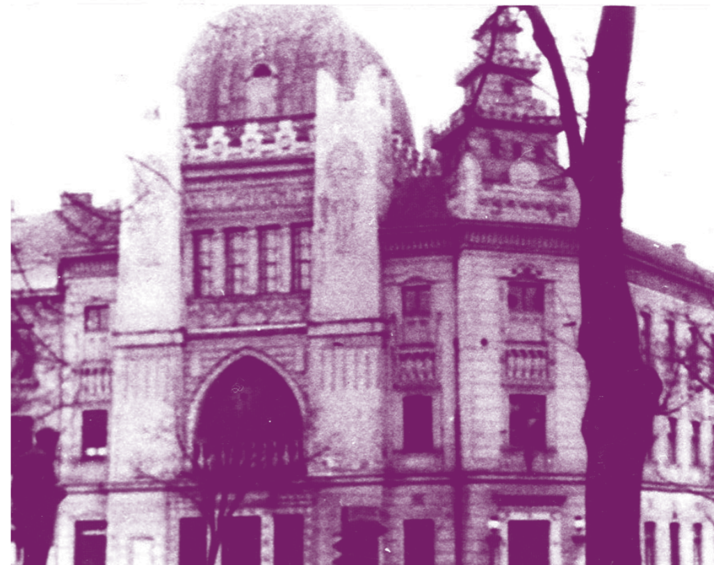
Synagoga v Hradci Králové