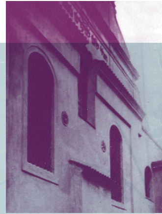
Synagoga v Kolíně