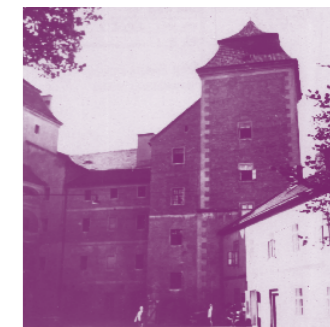
Shromaždiště Židů v Mladé Boleslavi

Druhá polovina 19. století přináší Židům občanské zrovnoprávnění. I mladoboleslavští Židé se stávají rovnoprávnou součástí svého města a integrují se do jeho veřejného života. Tento vývoj byl však narušen na konci 19. století během protizidovských a protiněmeckých výtržností po pádu Badeniho vlády, jež vydala jazyková nařízení dávající větší prostor češtině. V Mladé Boleslavi byla v noci z 3. na 4. prosince 1897 vytlučena okna v mnoha židovských domech. Poměrně klidné období v dějinách mladoboleslavské židovské obce v době první republiky je ukončeno okupací a dvěma transporty do ghetta v Terezíně na počátku roku 1943. 2