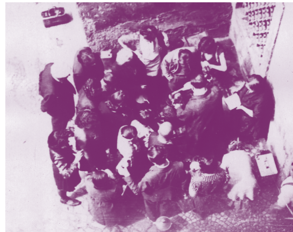
Židé na shromaždišti v Mladé Boleslavi