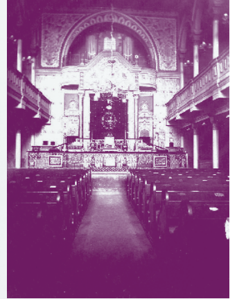
Interiér Hlavní synagogy, která se nacházela v dnešní Zeyerově ulici