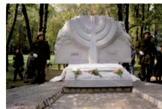
Fotografie pomníku obětem holocaustu v Ostravě