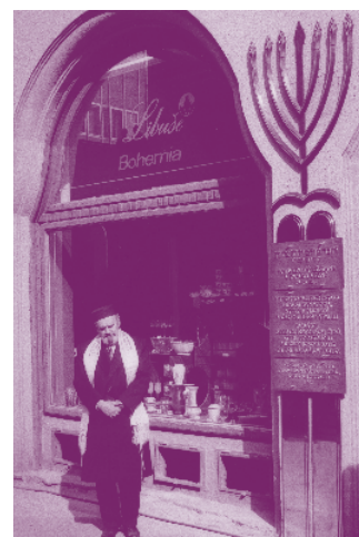
Památník Hlavní synagogy

Teprve po pádu komunistického režimu se otevřel prostor pro veřejnou diskusi o holocaustu. Postupně přibývaly informace v učebnicích a narůstal zájem médií. I přes velký zájem však toto téma dodnes není uspokojivě začleněno do příběhu českých dějin 20. století.