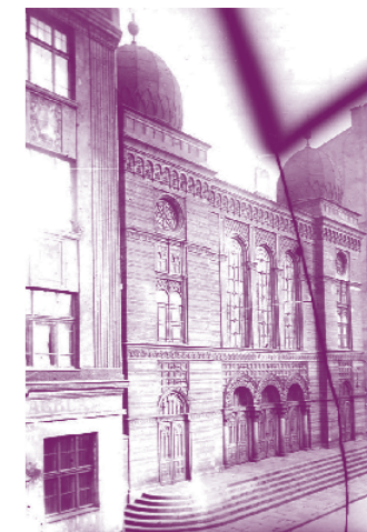
Hlavní synagoga, která se nacházela v dnešní Zeyerově ulici