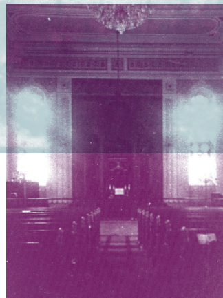
Interiér synagogy v Pardubicích