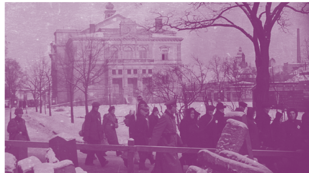
Transport Židů ze shromaždiště v Plzni na nádraží