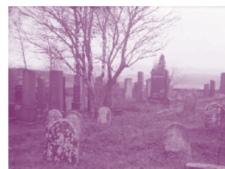
Starý židovský hřbitov

Teprve po pádu komunistického režimu se otevřel prostor pro veřejnou diskusi o holocaustu. Postupně přibývaly informace v učebnicích a narůstal zájem médií. I přes velký zájem však toto téma dodnes není uspokojivě začleněno do příběhu českých dějin 20. století