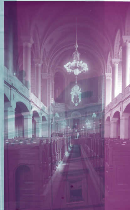
Interiér Velké synagogy