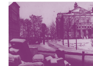
Transport Židů ze shromaždiště v Plzni na nádraží