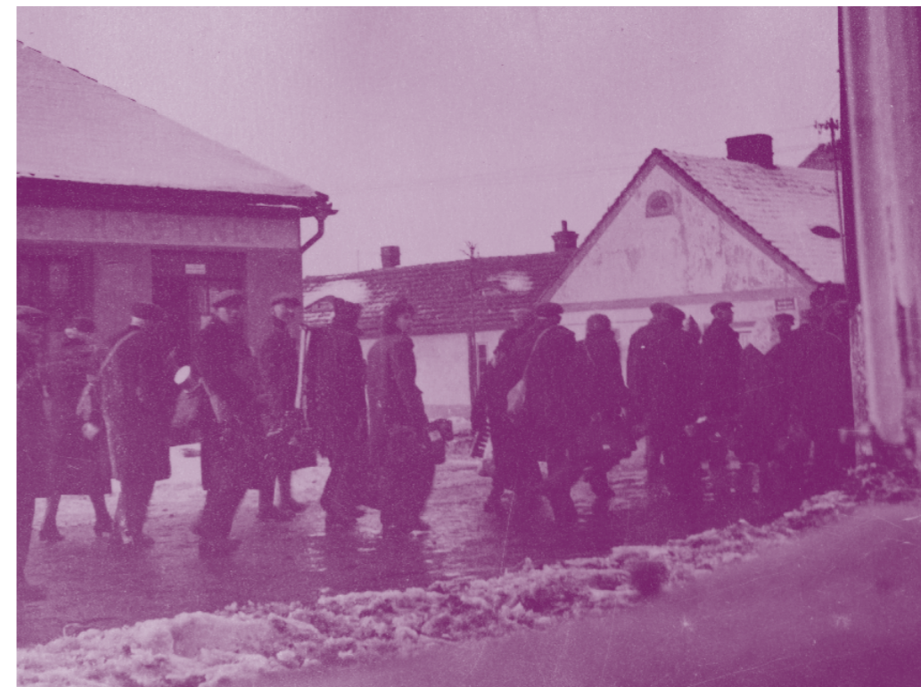
Transport do Terezína

V poslední třetině 19. století již nestačí rozrůstající se tábořské komunitě modlitebna, a tak se v roce 1884 přistoupilo ke stavbě velké synagogy podle plánů Josefa V. Staňka. Budova vystavěná v kombinaci maurského a novorománského stylu sloužila svému účelu do konce 30. let 20. století. Od roku 1941 se používala jako sklad konfiskovaného židovského majetku. Po roce 1945 byla svěřena do správy Židovské náboženské obci v Plzni. Obci však chyběly finance k potřebným opravám, objekt postupně chátral a v roce 1977 došlo k jeho demolicí. 3