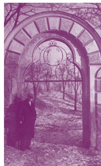
Zničená vrata na židovském hřbitově v Uherském Brodě