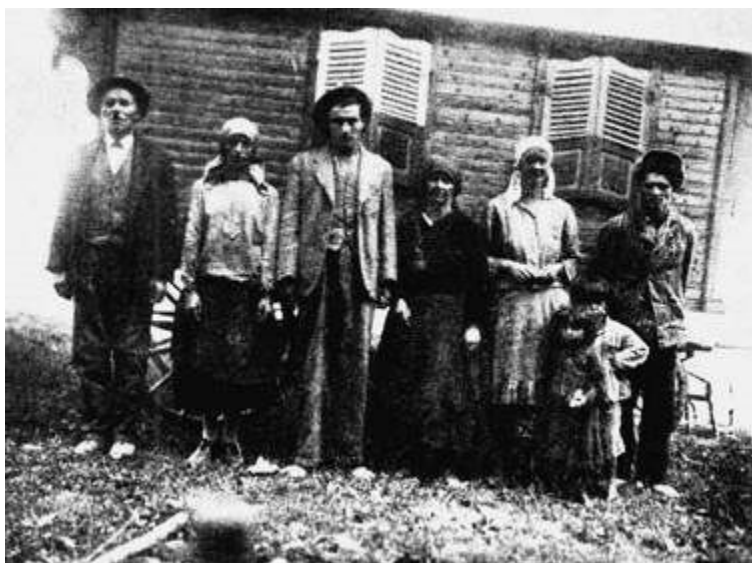
Romská rodina po nuceném usazení, 1940, časopis Bezpečnostní služba.

Jedním z trestů za nedodržení zákazu kočování bylo zařazení do kárných pracovních táborů. Tyto tábory byly otevřeny 10. srpna 1940 v Letech u Písku a v Hodoníně u Kunštátu. 8 Nařízení o jejich vzniku schválila česko-slovenská vláda Rudolfa Berana již 2. března 1939, tedy před vznikem Protektorátu, a měly sloužit k internaci „práce se štítících“ mužů, mezi nimi také „práceschopných potulných cikánů“. Do kárných pracovních táborů měli být umístěni muži starší osmnácti let, kteří nemohli prokázat zdroj obživy. 9 Po zákazu kočování měli být do těchto táborů zařazeni i muži z romských rodin, které by stále kočovaly. Muži vězněni v kárných pracovních táborech a považovaní za „cikány“ byli v táborové evidenci označováni velkým písmenem „C“ („cikán“). V závislosti na ročním období tvořili zpravidla 5 až 25 % všech internovaných. 10