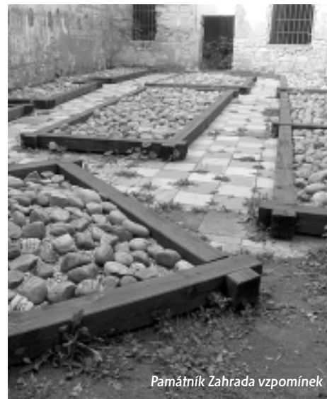
Památník Zahrada vzpomínek

Památník tvoří více než 2600 kamenů, každý kámen je nadepsán jménem oběti umučené během holocaustu. Památník nese zároveň symboliku židovské tradice, kdy pozůstalí pokládají kamínky na hroby zemřelých. Díky této výstavě se mohli návštěvníci seznámit s průběhem, okolnostmi a důsledky rasové perzekuce a likvidace Židů z oblasti Plzeňska. Výstavu bylo možné poprvé shlédnout ve Staré synagoze v Plzni v červnu roku 2002 a pro velký úspěch byla opět otevřena v roce 2003.