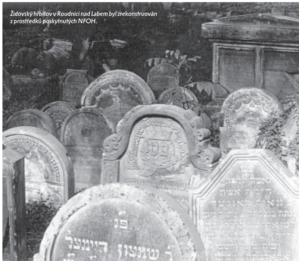
Židovský hřbitov v Roudnici nad Labem byl zrekonstruován z prostředků poskytnutých NFOH.

OBNOVU A ZACHOVÁNÍ MOVITÝCH A NEMOVITÝCH ŽIDOVSKÝCH PAMÁTEK NA ÚZEMÍ ČR