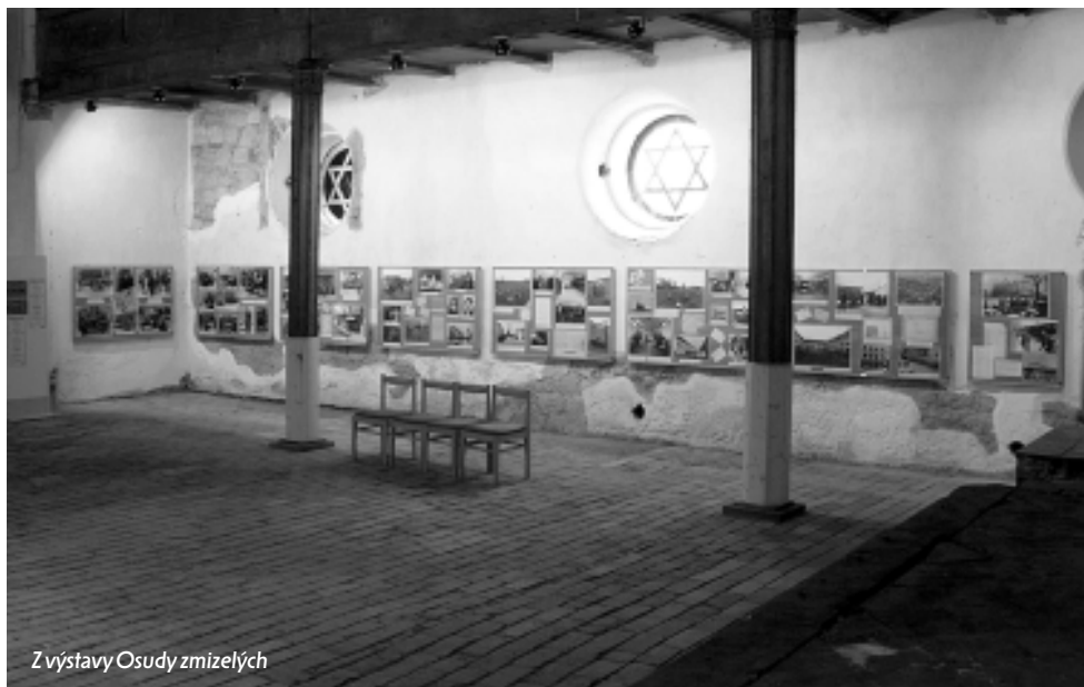
Z výstavy Osudy zmizelých

Řada návštěvníků, zejména z Plzeňského kraje, ocenila regionální rozměr výstavy, která vypovídala o jejich bývalých sousedech a spoluobčanech. V rámci výstavy byl také zpřístupněn památník obětím holocaustu s názvem Zahrada vzpomínek , jenž byl vytvořen při akci Napiš jedno jméno , které se zúčastnili zejména dobrovolníci a studenti plzeňských škol.