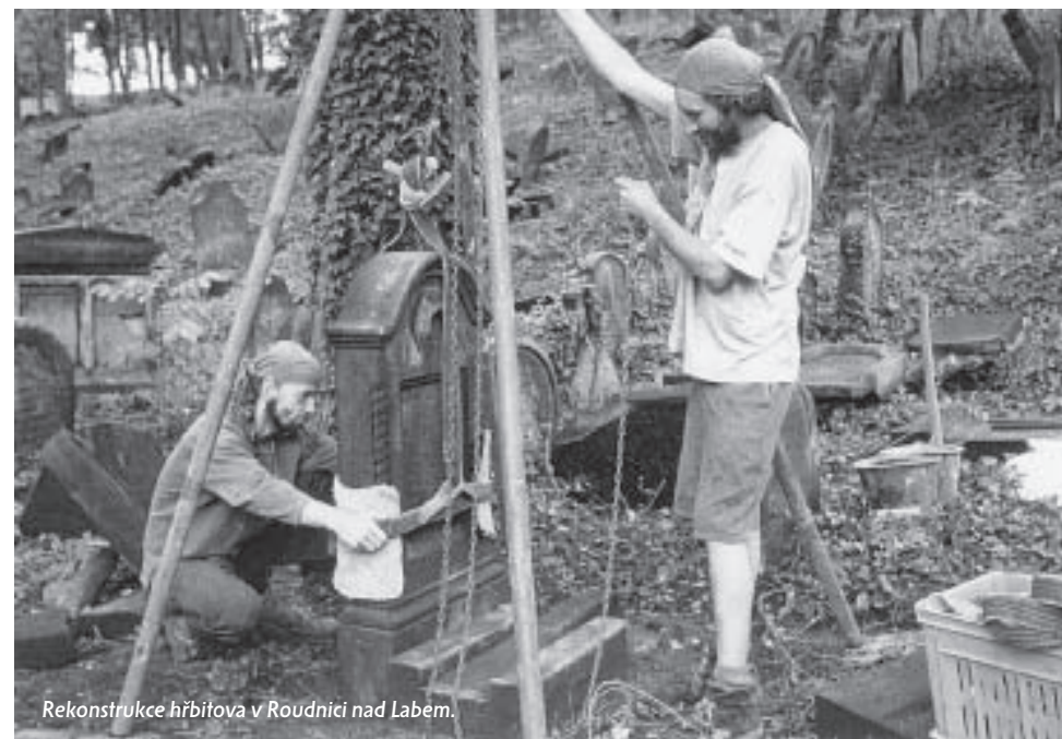
Rekonstrukce hřbitova v Roudnici nad Labem.

V roce 2003 tak směřovalo z prostředků NFOH na opravy památek ve vlastnictví FŽO 3,6 mil. Kč a bez zajímavosti jistě není skutečnost, že díky úsilí pracov-