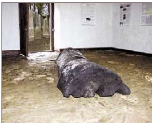
Dokumentační výstava v márnici židovského hřbitova

Významnou součástí památníku je dokumentační výstava, umístěná v bývalé márnici černoického židovského hřbitova, který je jedním z posledních autentických svědků života tamní židovské pospolitosti.