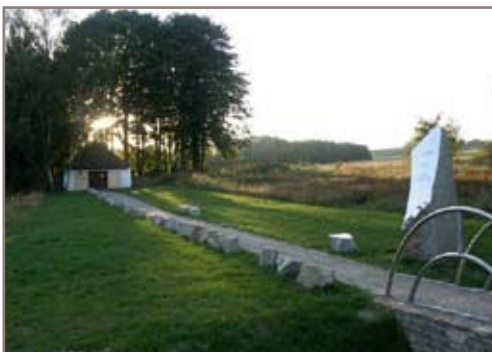
Pamětní pěšina- Židovský památník Černovice

Od 15. do 17. září 2006 pořádáme na tomto místě již potřetí Pedagogický seminář, během kterého připravujeme učitele na to, jak integrovat Pedagogický program Černovice do výuky. Seminář je určen především učitelům základních a středních škol v České republice. Jeho cílem je připravit vyučující osmých a vyšších ročníků v oborech dějepis, občanská výchova, jazyk, zeměpis a estetické předměty na mnohostranné mezipředmětové projekty. Svým komplexním projektovým zaměřením odpovídá Pedagogický program Černovice základním myšlenkám „Rámcového vzdělávacího programu“. Tento program by se mohl pro Vás a Vaše žáky stát zajímavou součástí výuky. Předchozí znalosti tématu jsou vítány, nejsou ale podmínkou účasti na semináři, ve kterém se pokoušíme o zprostředkování hlubších znalostí a zkušeností.