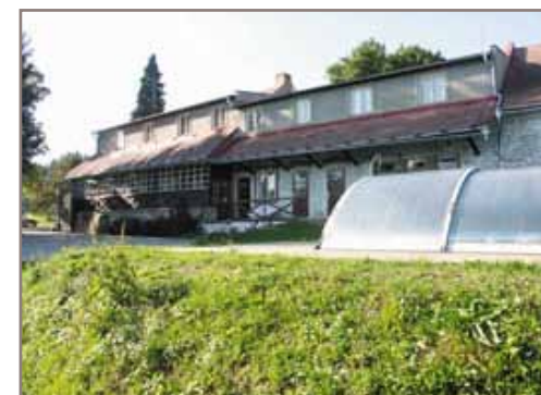
Místo konání semináře - rekreační středisko DÚSP Černovice

Třídenní seminář se koná v rekreačním středisku v blízkosti černovického památníku, na místě vybaveném potřebným zařízením, kam vyškolení vyučující mají později možnost jezdit se svými třídami i na vícedenní exkurze. Účastníkům nabízíme plnou penzi a možnost přenocování ve vícelůžkových pokojích.