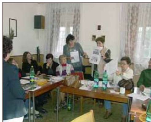
Účastníci semináře při práci s dokumenty

Zprávu o semináři z roku 2004 najdete na adrese: http://www.holocaust.cz/cz2/news/2004/cernovice