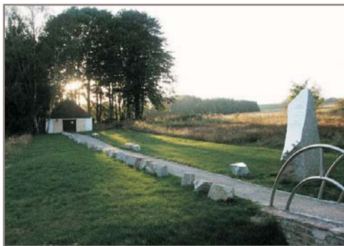
Pamětní pěšina - Židovský památník Černovice

Tento program by se mohl pro Vás a Vaše žáky stát zajímavou součástí výuky. Předchozí znalosti tématu jsou vítány, nejsou ale podmínkou účasti na semináři, ve kterém se pokoušíme o zprostředkování hlubších znalostí a zkušeností.