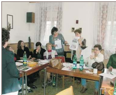
Účastníci semináře při práci s dokumenty

Článek o černovickém projektu v časopise MODERNÍ VYUČOVÁNÍ 1/2006 najdete také na adrese: http://www.modernivyucovani.cz/mv/clanek.aspx?a=1&pmlKod=MV_MY0601A03A