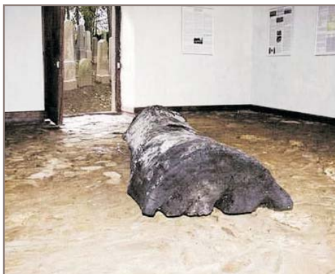
Dokumentační výstava v márnici židovského hřbitova

Významnou součástí památníku je dokumentační výstava, umístěna v bývalé márnici černovického židovského hřbitova, který je jedním z posledních autentických svědků života tamní židovské pospolitosti.