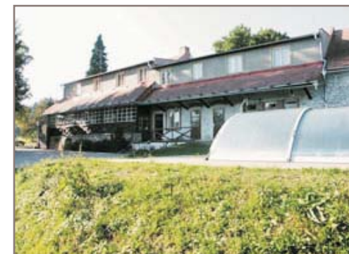
Místo konání semináře - rekreační středisko DÚSP Černovice

Třídenní seminář se koná v rekreačním středisku v blízkosti černovického památníku, na místě vybaveném potřebným zařízením, kam vyškolení vyučující mají později možnost jezdit se svými třídami i na vícedenní exkurze. Účastníkům nabízíme plnou penzi a možnost přenocování ve vícelůžkových pokojích.