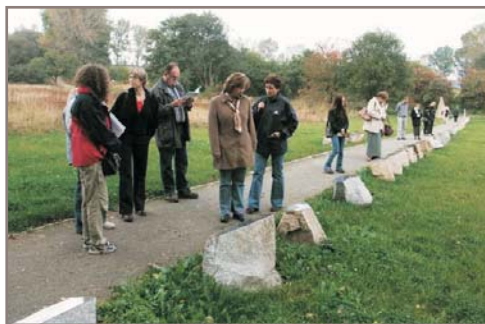
Účastníci semináře při práci na pamětní pěšině památníku