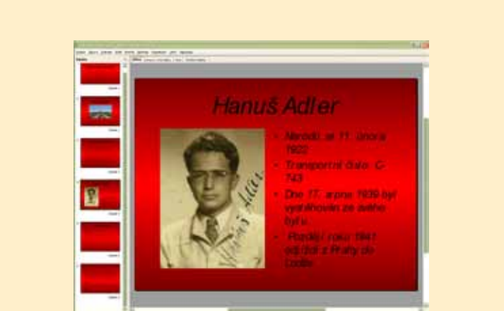
Ukáзка z prezentace práce na projektu Terezínské album ve škole žáků ZŠ J. Malíka v Chrudimi

Zákony a nařízení diskriminující a vyčleňující příslušníky židovské komunity od většinové společnosti byly po vzniku Protektorátu Čechy a Morava vydávány také na našem území. V rámci vzdělávacího projektu Židům vstup zakázán! Nabízíme učitelům a jejich žákům možnost seznámit se se systémem protizidovských opatření prostřednictvím digitalizovaných autentických vyhlášek, úředních nařízení a pokynů z mnoha obcí, které jsou tematicky rozděleny a komentovány.