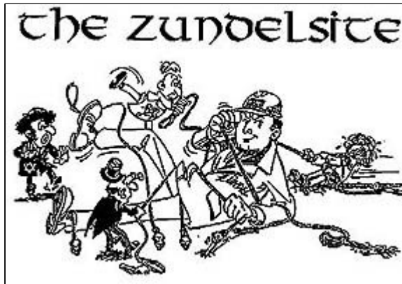
Ze stránek zundelsite.org