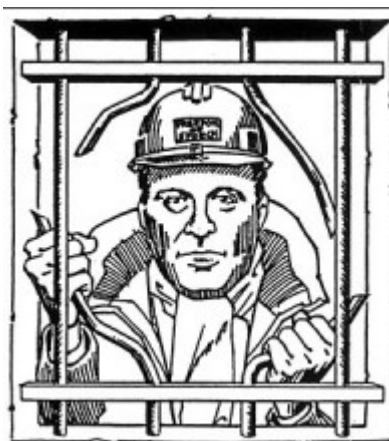
Ernst Zündel, ze stránek prefer-statement wz cz