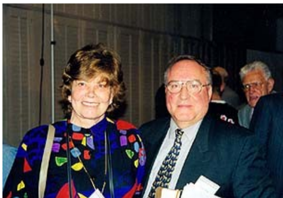
Ernst Zündel s manželkou Ingrid Rimland