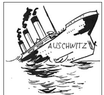
Ze stránek zundelsite.org